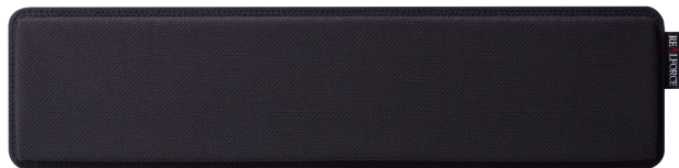
ジェル リストレスト 3/6 発売

GX1 用のオプション品として、長時間の使用でも快適性が持続する「ジェル リストレスト」(型番 M080201、製品価格 7,920 円税込) が GX1 と同時発売される他、より高速な入力と静音性を向上させる「GX1 キースペーサーセット」(日本語配列用および英語配列用) も近日発売予定です。