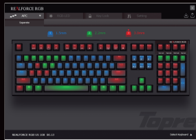
可调节触发键程的设定画面