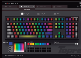
RGB背光的顏色設定畫面