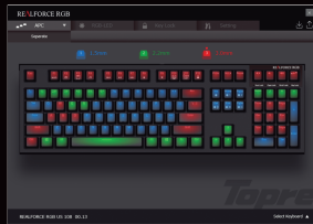
APC (Actuation Point Changer) setting APC(ON位置調節) 設定画面